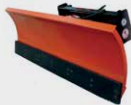
Відвали для снігу